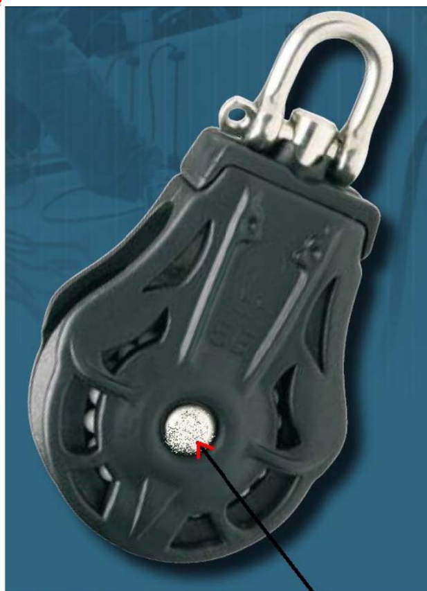
POULIE A MONTER